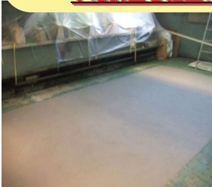
製造工場施工例 グレー

下地が荒れている床の復元に最適！高強度・高接着力！ 下地調整と仕上げが一度にできる仕上剤！デコボコ床が直る！