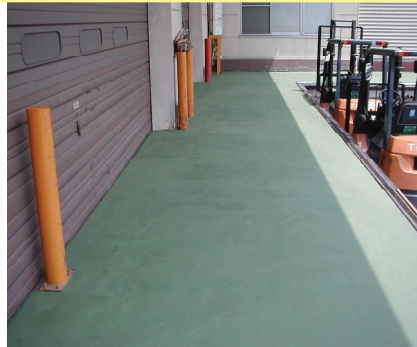
プラットホーム施工例 グリーン