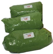
画像は 15kg セット (5kg × 3) 色: ライトグリーン