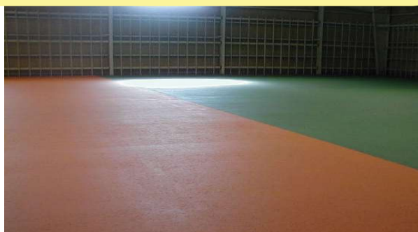
物流倉庫内の通行帯作成 オレンジ使用