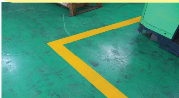
製本工場内のライン作成 イエロー使用

施工が簡単！翌日には使用可能！ ライン引き・通行帯の作成にはラインコートをご使用ください