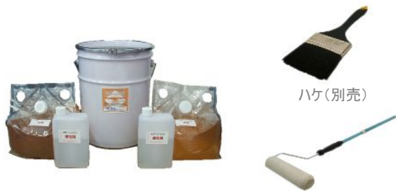
画像はフロアーシールS 18リットルセット ローラーセット(別売)