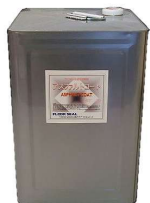
画像はアスファルトコート 18kg