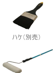
ローラーセット(別売)