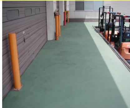
プラットホーム施工例 グリーン