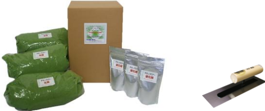
画像は15kgセット(5kg×3) 色:ライトグリーン