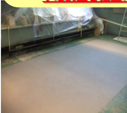
製造工場施工例 グレー

下地が荒れている床の復元に最適！高強度・高接着力！ 下地調整と仕上げが一度にできる仕上剤！デコボコ床が直る！