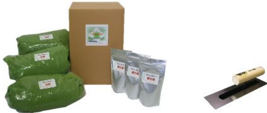
画像はチタンフロアー15kg ライトグリーン