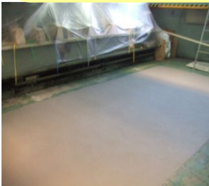
製造工場施工例 グレー

下地が荒れている床の復元に最適！高強度・高接着力！ 下地調整と仕上げが一度にできる仕上剤！デコボコ床が直る！