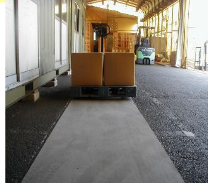
通行帯作成施工例 グレー