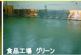
食品工場 グリーン