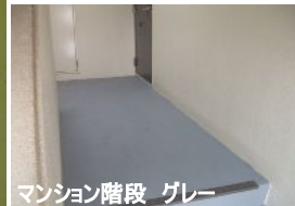
マンション階段 グレー