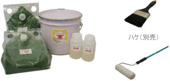
セーフティーフロアー 10リットル