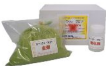
セーフティーフロアーお試しセット ライトグリーン

初めての方はお試しセットをご使用下さい。 価格 3,150円(税込) 送料 630円(税込) ※製品購入合計金額 5,250円(税込) 以上で送料無料 施工可能面積 約 2㎡(2回塗り仕上げ) セット内容 箱入り(主剤・硬化剤・取扱説明書・ビニール手袋)