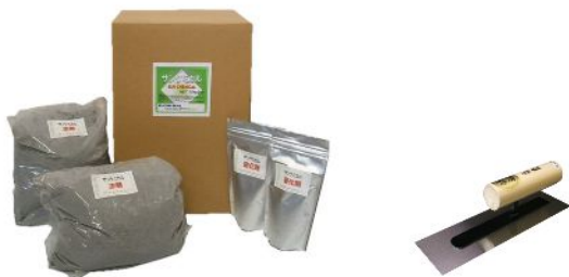
画像は 10kg セット(5kg × 2)