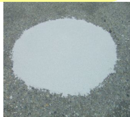
大きなエグレの補修 床に穴があると、とても危険です