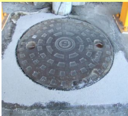
マンホール廻りの補修