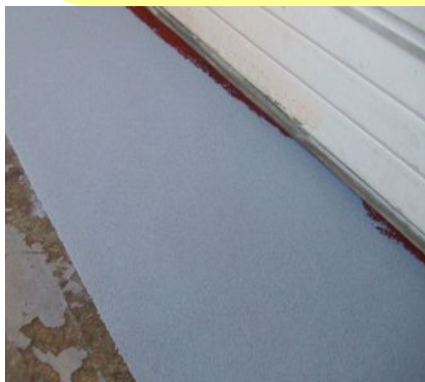
出入口の段差の補修 スロープの作成も簡単

従来のモルタル補修ではすぐに壊れてしまいます！ 皆様方で簡単に使えるサンケミカルで、床の破損箇所を修繕できます！