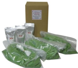
画像は 14.7kg セット(4.9kg×3) 色:ライトグリーン