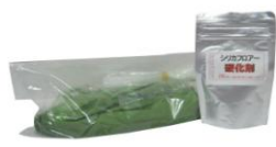
お試しセット(ライトグリーン)

初めての方はお試しセットをご使用下さい。 価格 3,240 円(税込) 送料 648 円(税込) ※製品購入合計金額 5,400 円(税込) 以上で送料無料 施工可能面積 約 50 cm角 セット内容 主剤・硬化剤・取扱説明書・ビニール手袋 まずは、お試しセットでシリカフロアーの強度・接着力を是非1度、体験してみてください。 選べるカラーは全 10 色