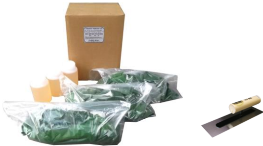
画像は 15.3kg セット(5.1kg×3) 色:グリーン