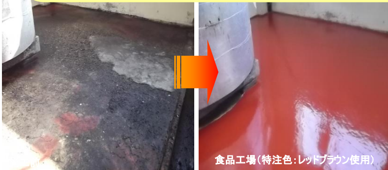
食品工場(特注色:レッドブラウン使用)

早急に補修したい破損個所に最適！速乾性があり、 高強度・高接着力で早く丈夫な床に生まれ変わります！