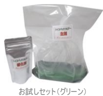
お試しセット(グリーン)