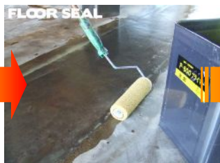
P-600プライマーを 全面にローラーで塗布