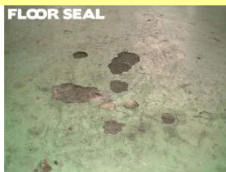
製造工場 補修箇所に油が染み込んでいる場合