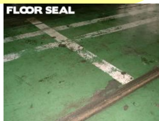
自動車整備工場 塗装表面に油分がある場合