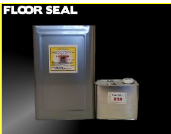
P-600プライマー 13.5kgセット