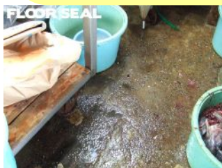
生鮮工場 下地に油・水がある場合

下地コンクリートが下記のような場合には P-600プライマーを使用してから塗装・補修をしてください！