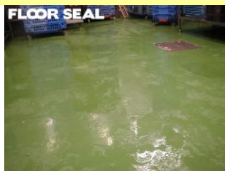
食品工場 下地を完全乾燥できない場合