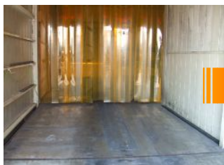
下地に油分がある食品工場