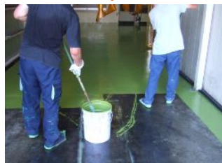
P-600プライマー硬化後、 HQタイプを塗布してください