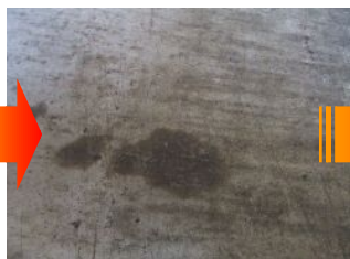
油が染み込んでいます