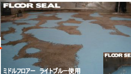
ミドルフロアー ライトブルー使用

シリカフロアーでリニューアルをする際に、あらかじめ大きなエグレやデコボコをミドルフロアーで下地調整することにより、より一層、平滑で強靱な床に仕上がります。