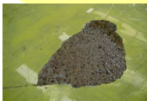
食品工場床のハグレの補修に