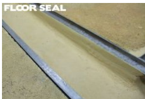
破損した側溝の補修に