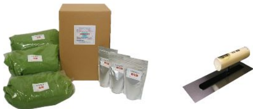
画像はミドルフロアー15kg ライトグリーン コテ(別売)