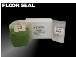
お試しセット ライトグリーン