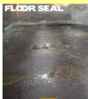
シリカフロアーを施工する際の中塗り剤として使用