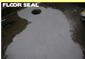
お湯が流れる排水溝周りの補修に