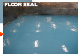
シリカフロアー ライトブルー仕上げ

シリカフロアーでリニューアルをする際に、あらかじめ大きなエグレやデコボコをミドルフロアーで下地調整することにより、より一層、平滑で強靱な床に仕上がります。