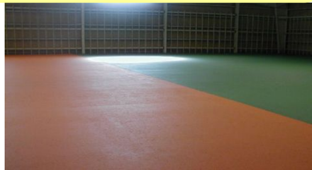
物流倉庫内の通行帯作成 オレンジ使用