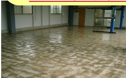
自動車整備工場 塗布例

打設したばかりのコンクリート床には ファーストプライマーを使用してから塗装・補修をしてください！