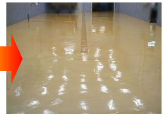
プライマーが硬化(乾燥)したら、 シリカフロアーを施工します