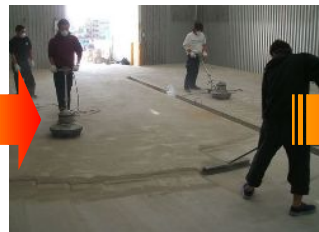
表面のレイトンス(ホコリ)を 掃除します