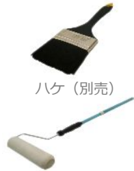
ローラーセット (別売)