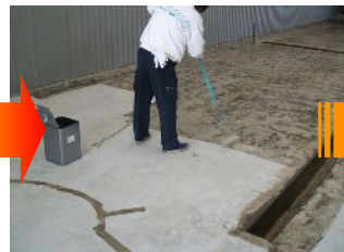
ファーストプライマーを 全面にローラーで塗布