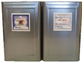
ファーストプライマー 18kg