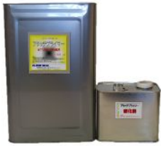
アタッチプライマー 13.5kg