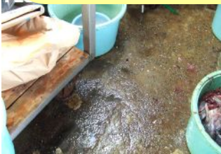
生鮮工場 下地に油分がある場合

下地コンクリートが下記のような場合には アタッチプライマーを使用してから塗装・補修をしてください！