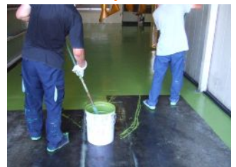
アタッチプライマー硬化後、 HQタイプを塗布してください