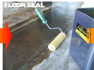
アタッチプライマーを 全面にローラーで塗布