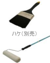
ローラーセット(別売)