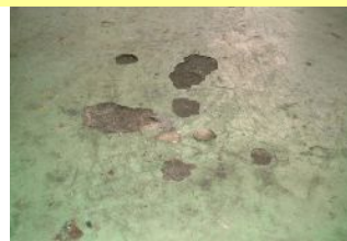
製造工場 補修箇所に油が染み込んでいる場合