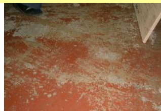
製本工場 下地に塗料が残っている場合