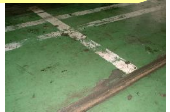
自動車整備工場 塗装表面に油分がある場合