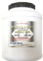
画像はアスファルトライン 2kg