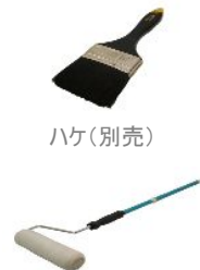
ローラーセット(別売)