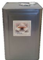
画像はアスファルトコート 18kg